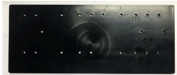
Rückseite (bei Montage auf IPPx-Profile 200x1150 rechts von der Vertikalleiste)