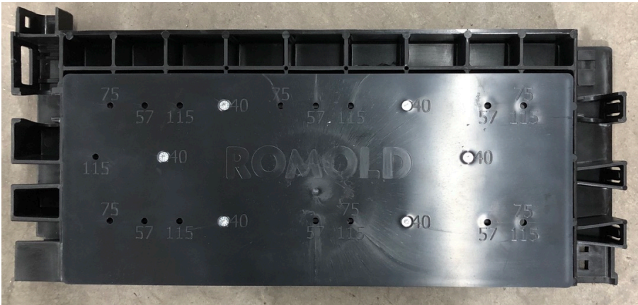
Beispiel: Montageplatte an IPP2 Profile 200x400 (mit 6 Spax)