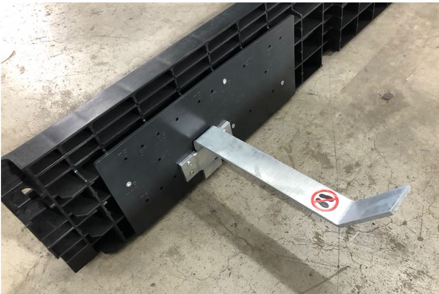
Beispiel: Montageplatte an IPP3 Profile 200x1150 und montierter Muffenablage passiv